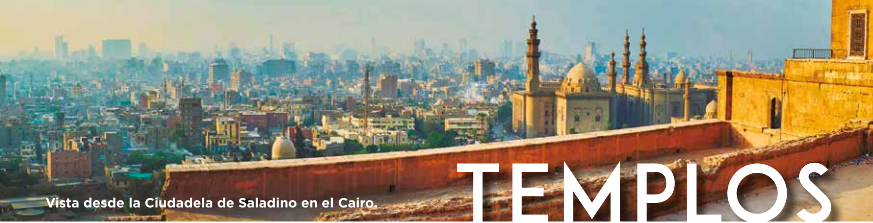
Vista desde la Ciudadela de Saladino en el Cairo.